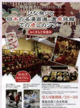
「おもてなし交流事業 菊池市商工会女性部」で検索

■開催日時／2月15日・22日 3月1日・8日 ※いずれも10時～15時 ■開催場所／よっこい処